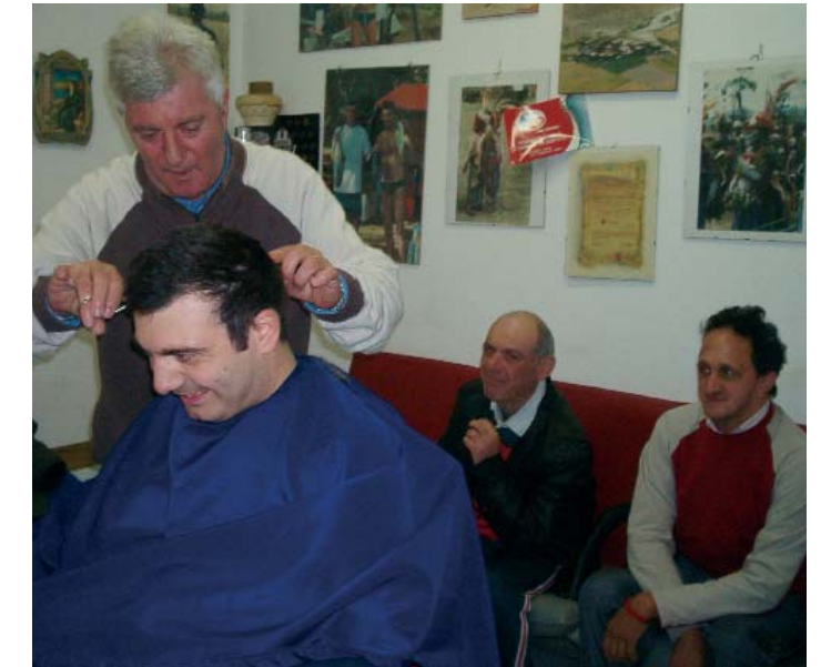
DA CELE', BARBA E CAPELLI