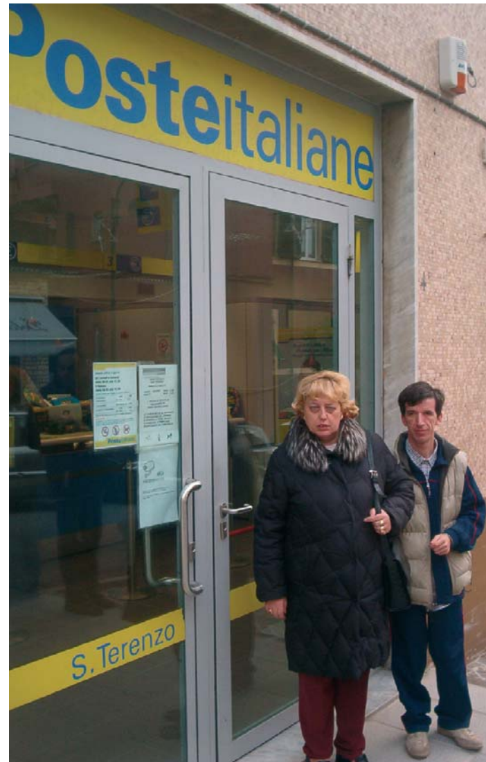
ALLE POSTE DI SAN TERENZO