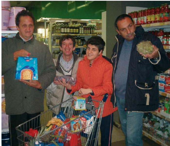
COMPERE PER CASA FAMIGLIA ALLA COOP