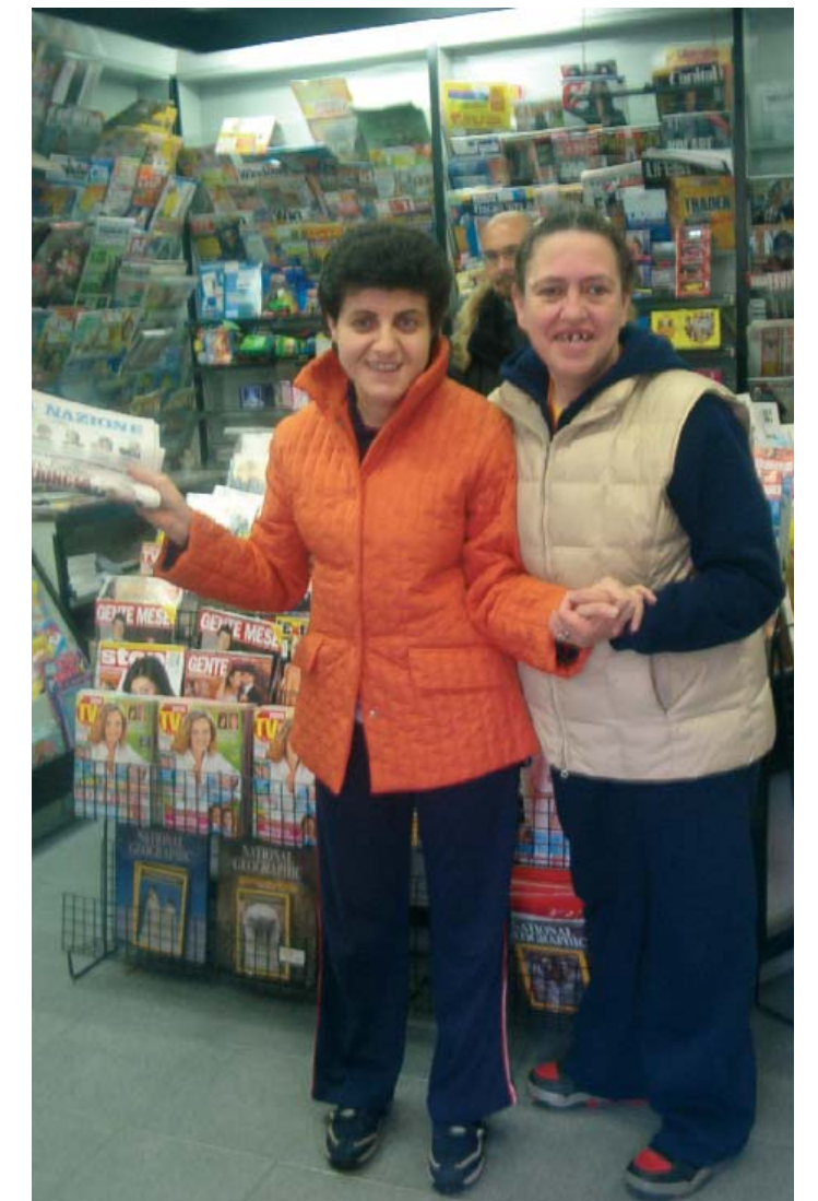
ALL'EDICOLA PER IL GIORNALE DEL MATTINO