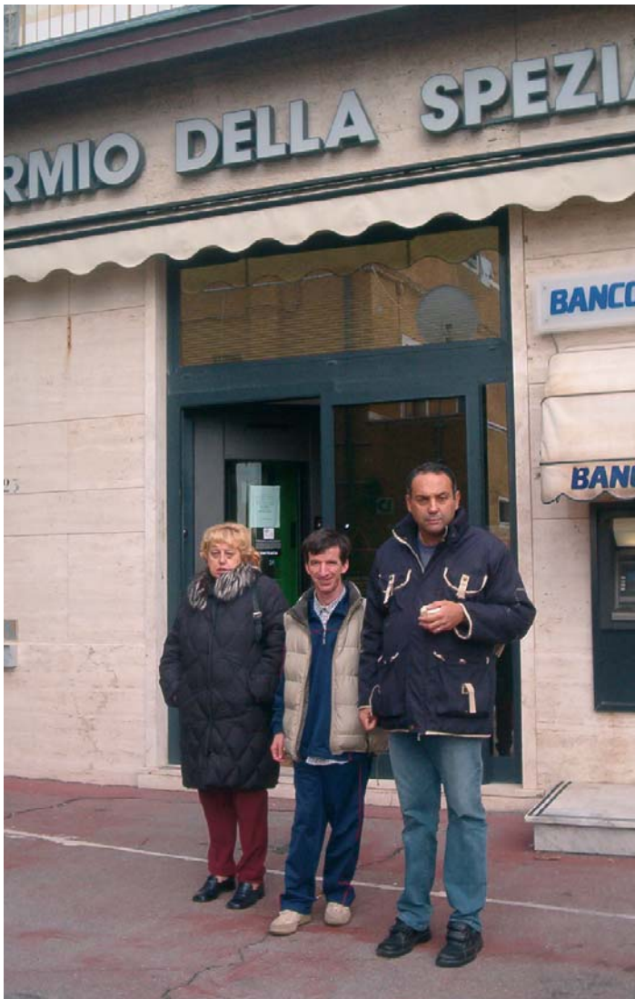
IN BANCA A SAN TERENZO